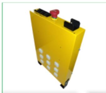
Botoeira de Inspeção

Em suma, a modernização com a aplicação em conjunto de seus acessórios, tem por finalidade básica garantir uma maior segurança e melhor performance dos seus elevadores, mantendo-os com componentes mais seguros e também adequando-os com as mais recentes normas técnicas de instalação para Aparelhos de transporte vertical (Elevadores) no Brasil.