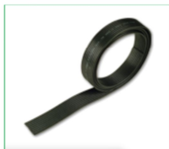
Cabo de Manobra