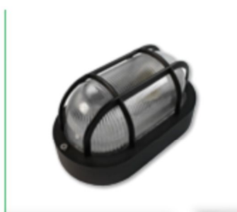
Iluminação do Poço