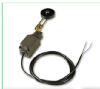
Limite de Fim de Curso