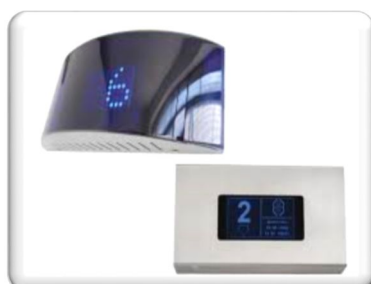
IPD'S - DE SOBREPOR SUPERIOR

Abaixo estão alguns exemplos do componentes que podem fazer parte da modernização de seu condomínio: