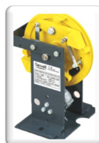
LIMITADORES DE VELOCIDADE