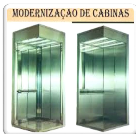
CABINES EM AÇO INOX NOVAS OU REVESTIDAS