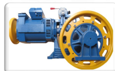
MÁQUINA DE TRAÇÃO