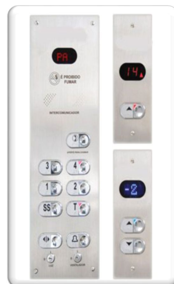
BOTONEIRAS DE CABINA E PAVIMENTO