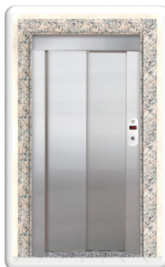
PORTAS DE PAVIMENTO AUTOMÁTICAS