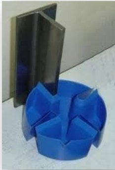
Figura 1 Coletor de óleo na base da guia